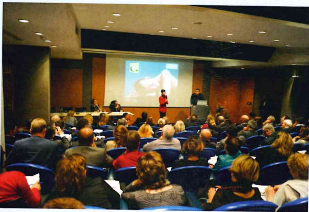
▲ Conférence « les stratégies gagnantes la polysensorialité »

Ce fut également l'occasion de présenter l'étude sur l'Expérience Sensorielle Conformée dont les premiers résultats démontrent l'intérêt de la cliente à vivre une expérience polysensorielle. Les résultats finaux seront communiqués au deuxième semestre 2015.