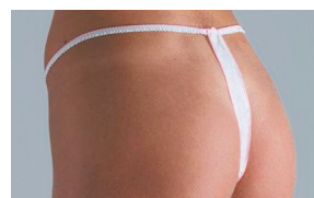
String jetable pour femme

Emballé individuellement. Taille unique. Boîte de 100.