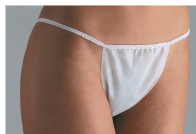
Slip jetable pour femme

Coloris Blanc. Taille unique. Boîte de 100.