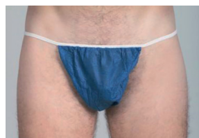
Maillot jetable pour homme